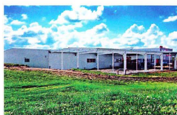
Výstavba nové výrobní haly tiskárny H.R.G., spol s r.o.

jedinečnou a velkolepou knihu o našem městě – Litomyšl 1259–2009 město kultury a vzdělání. Kniha má rozsah 616 stran a je vtištěna na překrásném voluminózním italském papíře. Naše radost je o to pak větší, že kniha získala titul Nejkrásnější česká kniha roku 2009 v kategorii odborná literatura. Zahájení výstavby nové výrobní haly Začátkem května byla započata výstavba nové výrobní haly navazující na stávající výrobní prostory. Do haly bude přesunuto výsekové centrum a sklady odpadového hospodářství, které ustoupí novému tiskovému stroji ve formátu B1. Objekt bude v budoucnu též propojovacím prvkem pro další plánované rozšiřování výrobních prostor. Vydáváme edici „Polygrafických taháků“